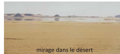
mirage dans le désert

Aujourd'hui, un des syndicats signataires dénonce la trahison dont il ferait l'objet de la part du ministère. Une naïveté qui n'est pas de mise de la part de responsables syndicaux.